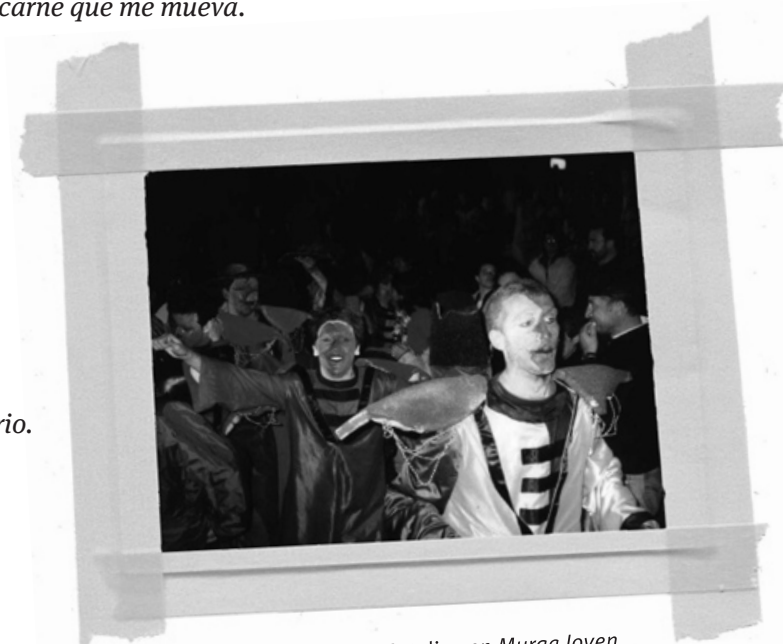
La Catalina en Murga Joven.

Mis próximos prójimos conspirando, incendiando para siempre las fronteras.